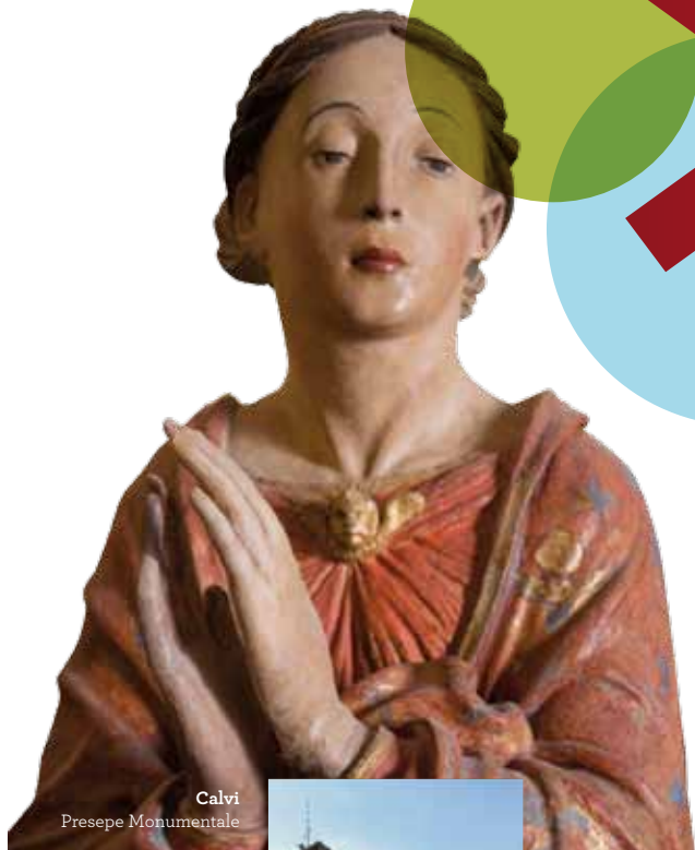
Calvi Presepe Monumentale