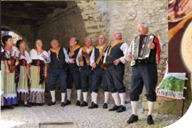
Ferentillo "Cantori della Valnerina"