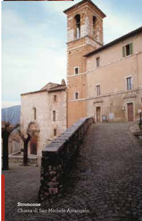
Stroncone Chiesa di San Michele Arcangelo