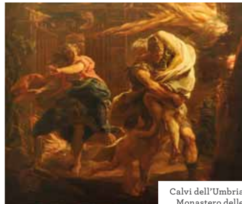
Calvi dell'Umbria Monastero delle Orsoline

6 Volo della Befana. Info: www.comune.stroncone.tr.it Stroncone