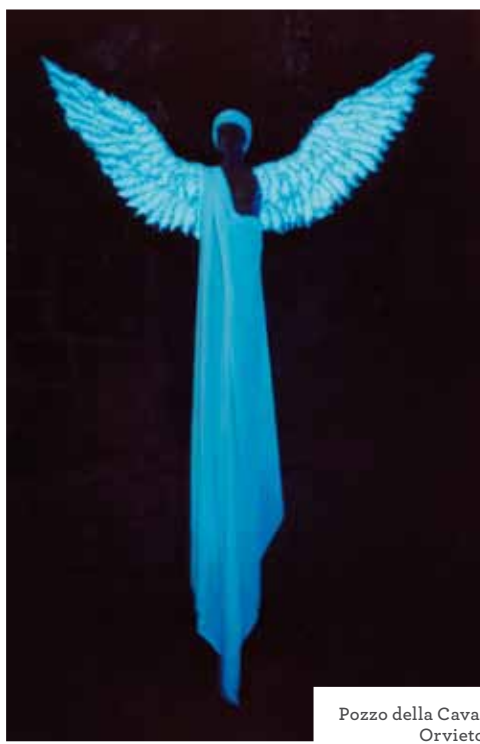
Pozzo della Cava, Orvieto

28/12/17 > 01/01/18 Umbria Jazz Winter#25 Festival Internazionale di Musica Jazz. Info: www.umbriajazz.com e-mail: info@umbriajazz.com Accompagnato dalla manifestazione "Orvieto diVino" con degustazioni dei migliori vini del consorzio Vino Orvieto. Info: www.stradadeivinietruscoromana.it Orvieto